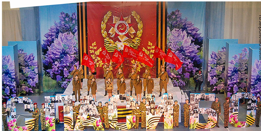
В СКК «Олимп» состоялся торжественный приём ветеранов главой города, администрацией и Думой города Невинномысска

Коллектив ГБОУ СПО «Невинномысский агро-технологический колледж» Краевой центр содействия трудоустройству выпускников